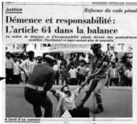
"un "démént" maitrisé par la police"

ATTENTION : présenter chaque montage sur une feuille avec votre nom, prénom et classe. Découpage et Collage soigné. Respecter les alignements. Marquer le sens de l'image pour chaque titre.