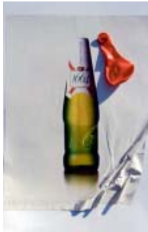
S. Heimbacher, Collège Foch Strasbourg - 2002-03

pour chaque montage, inscrire derrière la feuille ou en dessous, quel est le sens que vous pensez donner à chaque image.