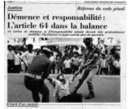
"arrestation arbitraire d'un manifestant"