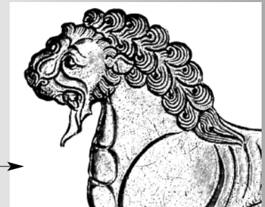
Iran 7° siècle

Le geste vivant et dynamique ou le geste calme et précis ?