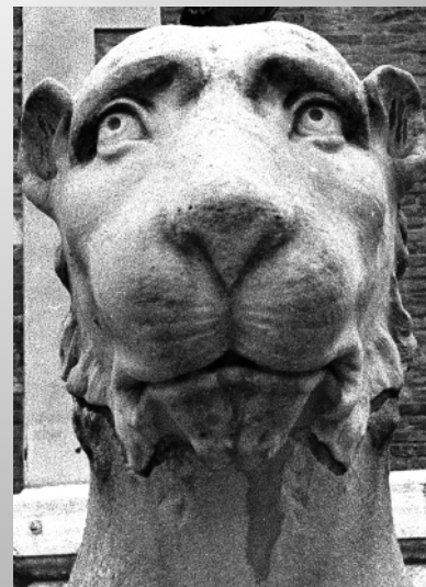
Lion à Venise

A vous de chercher des solutions variées, des combinaisons originales de techniques. A vous de faire un maximum d'essais que vous présenterez dans votre dossier final.