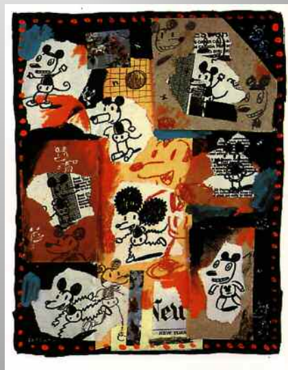
Gary Baseman - My Mind