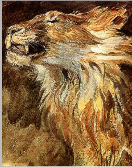
Aquarelle de Delacroix - 1843