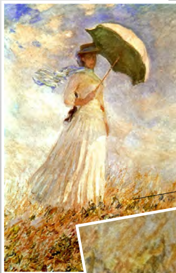
Claude Monet, Femme à l'ombrelle 1890

textures = accumulation de touches de pinceau